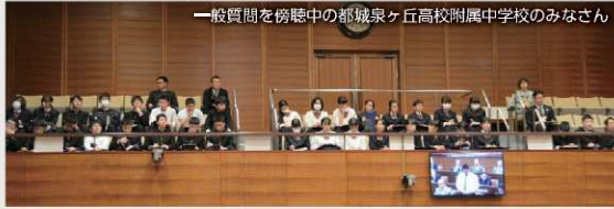
一般質問を傍聴中の都城泉ヶ丘高校附属中学校のみなさん