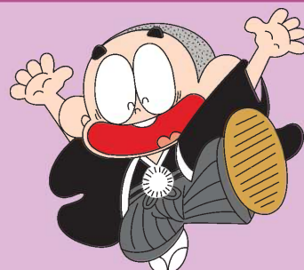
都城市PRキャラクター「ぼんちくん」