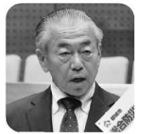
社民 福島 勝郎