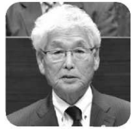
社民 筒井 紀夫