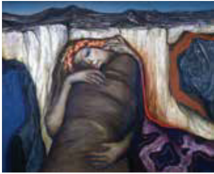
しらす 「白洲の里」(1979年)