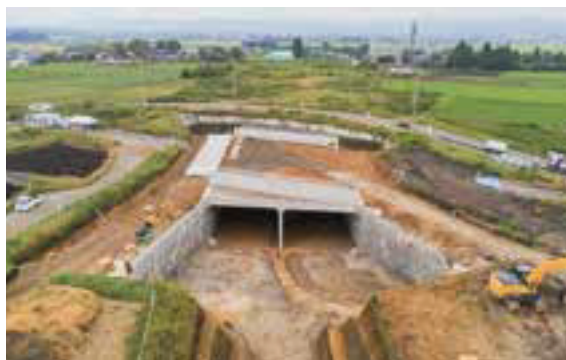
現在工事中の都城志布志道路・乙房IC（仮称）

場で製造したコンクリート部材と現場打ちコンクリートを併用して作った「3分割の大断面ボックス」を現地で組み立てることで、工期を大幅に短縮することに成功しました。この技術を活用し、都城志布志道路の主な立体交差を施工しています。