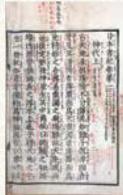
日本書記巻第一(都城島津邸蔵)

681年、天武天皇の命令で編 さんが開始されたといわれる「日 本書記」。天武天皇の死後、養老4 (720)年に完成しました。神々 や国土の誕生に始まる神話から持統 天皇11(697)年8月までの歴代 天皇の業績や事件が記されています。 本史料には、南九州にゆかりのあ る説話や人物も数多く登場。禊をす るイザナギ、高千穂峰に降り立つホ ノニニギ、海幸彦・山幸彦、ヤマト タケルの熊襲征討、現在の早水神社 (早水町)に祭られる髪長媛と諸皇 君など、私たちにもなじみのある神 話や伝承が記録されています。 本史料は、約1,300年前の日 向や大隅、薩摩の様子や、当時の政 権と地方の関係を現代に伝える上で も、大変貴重な史料です。