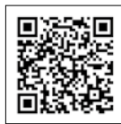
ぼんちくんイラスト