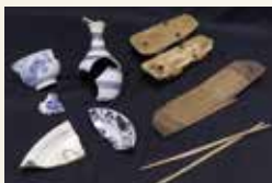
井戸からの出土品

市は、平成27年、中心市街地整備に伴い、唐人町があったとされる区域(中町遺跡)の発掘調査を実施し、江戸時代初めごろの井戸を発見。その中から、薩摩焼の甕や唐津焼の碗・皿、木製の箸など生活道具が一式見つかりました。これらの出土品は、当時の人々の暮らしを物語るとともに、唐人町の様子をうかがい知ることができ、貴重な史料です。