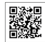
マイナポータルホームページ