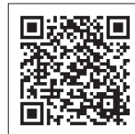
都城市男女共同参画センター