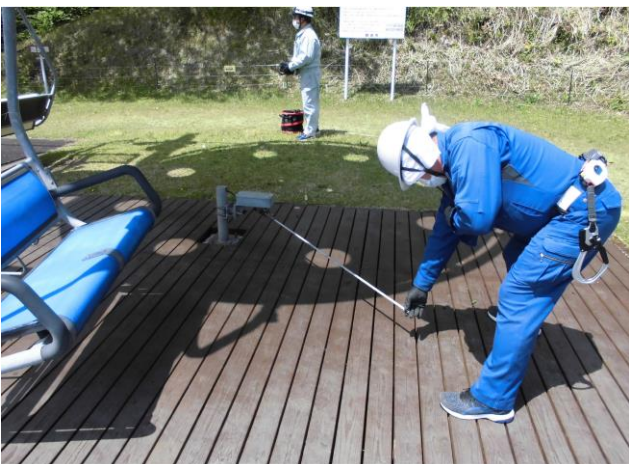
山頂停留所乗越検出装置作動確認