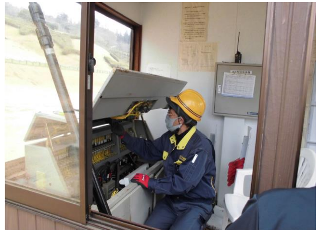
山麓停留所操作盤点検