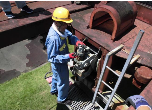
非常用ブレーキ確認