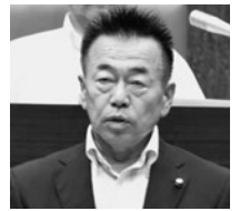
社民 福島 勝郎