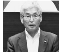
社民 筒井 紀夫