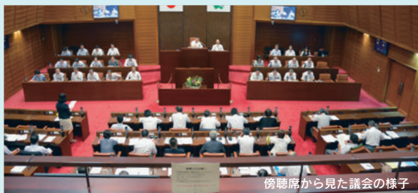
傍聴席から見た議会の様子

本会議・委員会は、どなたでも傍聴できますので、詳しくは議会事務局にお問い合わせください。また社会見学や団体研修の場としても幅広くご利用ください。