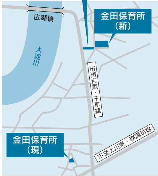
広瀬116号線工事区間