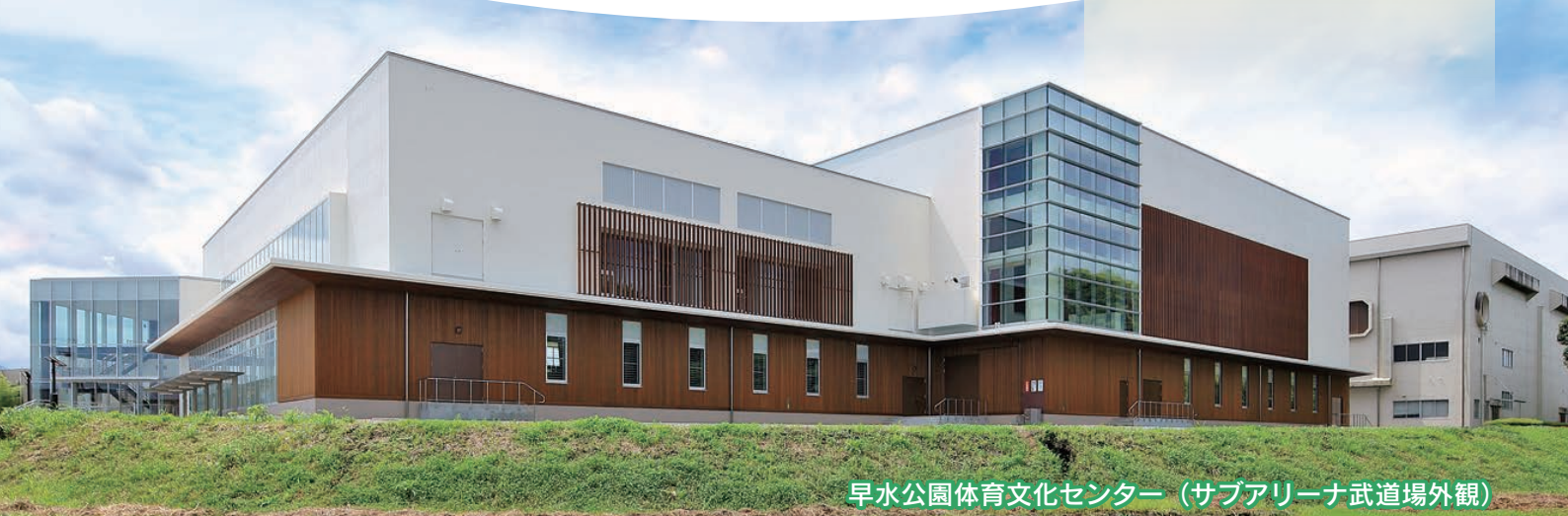
早水公園体育文化センター（サブアリーナ武道場外観）