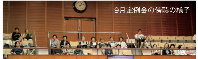
9月定例会の傍聴の様子