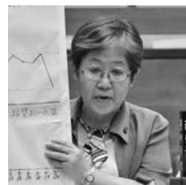
日本共産党都市議員 森 りえ