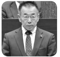
社民 福島 勝郎