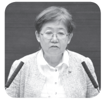
日本共産党都市議団