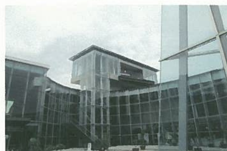
雲仙普賢岳災害記念館（がまだすドーム）

1 熊本市視察 危機管理・防災対応について平成24年7月12日九州北部豪雨で熊本市は甚大な水害に遭遇した。