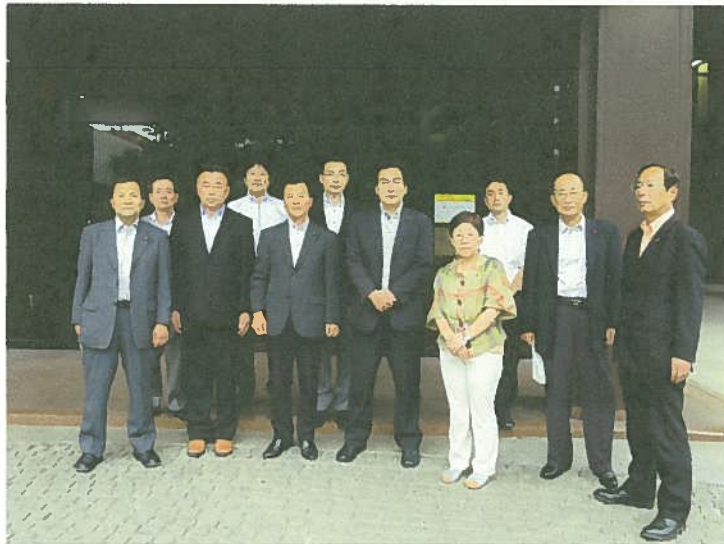
～ 熊本市議会棟玄関での研修委員等集合写真～

トリアージの作成によって、埋もれていく情報の皆無にもつながり、事案によっては即座にトリアージで担当者への下命も可能で迅速な処理が行えるものと思う。もちろん、事後の反省や記録にもつながるシステムで、都城市のマニュアル作成に参考にすべきものであると考える。