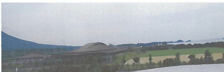
～災害発生時は支援拠点や避難所ともなり得る雲仙のスポーツ施設～