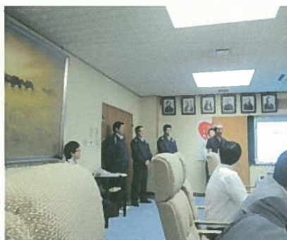
大杉市議会事務局長挨拶