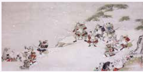
「黄瀬川の対面」(江戸前期～中期)