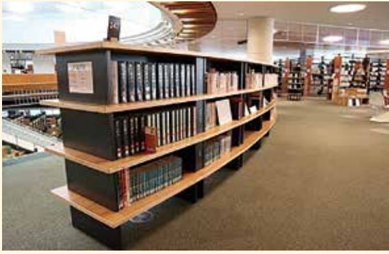
市立図書館 2階の年表書架コーナー

市立図書館の2階に、「年表書架」という円弧形の棚があります。古代・中世・近世・近代・現代の時代順にぐるっと本を並べ、上段に日本、中段に都城市周辺、下段に世界の本をエリア分けて設置しています。同じ時代に日本と都