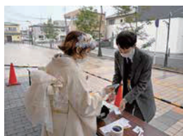
①ワクチン接種済み証明(2回)などの確認