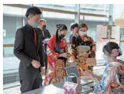
③混雑緩和のためバーコード受付