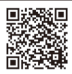
市消費生活センター