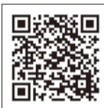
市男女共同参画センター