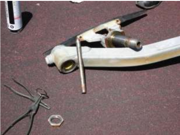
搬器握索装置分解点検