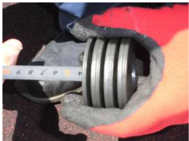
握索装置サラバネ厚点検