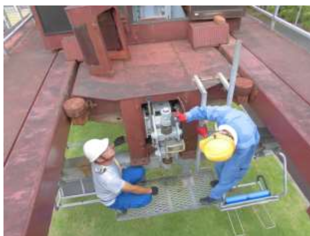
減速機グリス状況点検