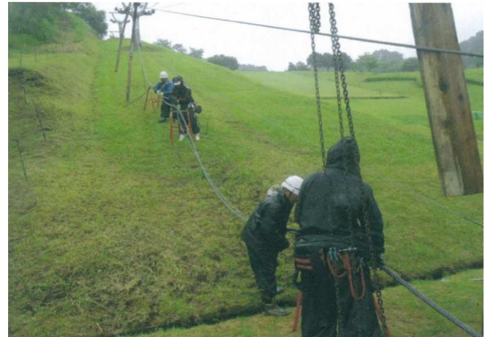
< 鋼索 (ワイヤー) 切詰 >