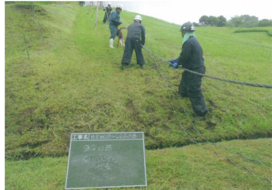
< 鋼索 (ワイヤー) 切詰 >