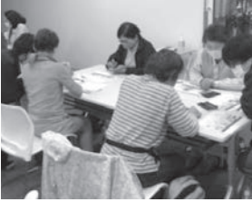
スマホ講習会の様子 (イメージ)