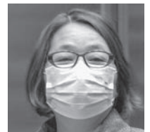
日本共産党都市議員 畑中 ゆう子