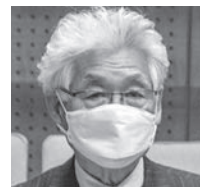
立憲民主 筒井 紀夫