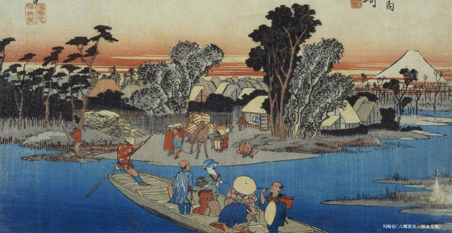
川崎宿「六郷渡舟」(保永堂版)