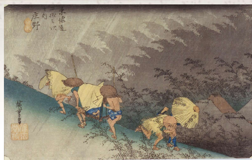
庄野宿「白雨」(保永堂版)