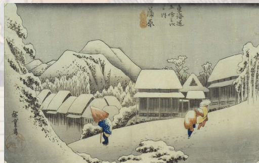
蒲原宿「夜之雪」(保永堂版)