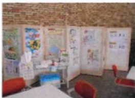
<市民サロンでのパネル展示>