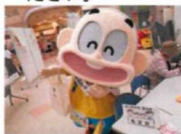
<店舗での街頭啓発>

消費者が自立し、安心安全な生活を送るために様々な啓発活動を行っています。市民参加のイベントもありますので、開催の際はぜひご参加ください。