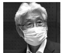
立憲民主 筒井 紀夫