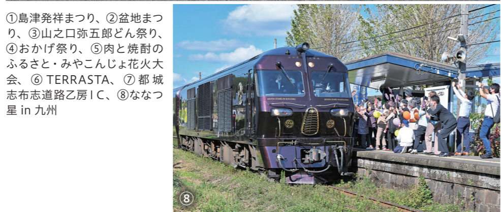
①島津発祥まつり、②盆地まつり、③山之口弥五郎どん祭り、④おかげ祭り、⑤肉と焼酎のふるさと・みやこんじよ花火大会、⑥ TERRASTA、⑦ 都城志布志道路乙房IC、⑧ ななつ星 in 九州