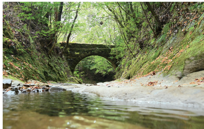
「桂ヶ谷水路橋」 (山之口町山之口)

世界に1枚のオリジナルマンホール ポケモンの絵が描かれたマンホールのふた「ポケふた」を知っていますか。「宮崎だいきポケモン」に任命されている「ナッシー」と「アローラナッシー」が、県内各市町村の特徴を表したデザインで描かれ、各所に設置されています。都城市のポケふたは、「日本一星の美しい街」に7度も選ばれた高崎町の夜空がモチーフとなっていて、アローラナッシーとナッシーが描かれています。このポケふたは、世界に1枚しかないオリジナルデザイン。中心市街地のワンパーク内(ウエルネス交流プラザ北側)で見ることができないマンホールです。まちなかを訪れた際には、かわいらしいアローラナッシーが描かれたポケふたを探してみませんか。