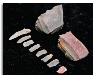
池増遺跡出土の石器