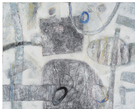
「遊」(2007年) 黒木 アヤ子作(油彩、キャンパス)