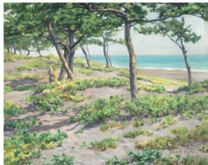
「三保松原」(1953年) 和田 英作 作(油彩・キャンパス)