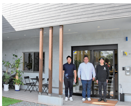
石崎社長(中央)と従業員の皆さん