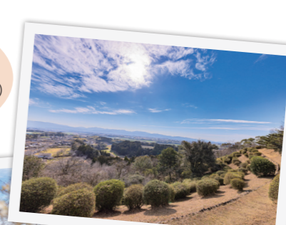
母智丘神社からの展望

際、展望台から見える景色の美しさに瞬く間に好手や妙手が出てきたことによりです。これから新緑の季節。フोटospotを巡りながら、ぜひ森林浴を楽しんでみてください。