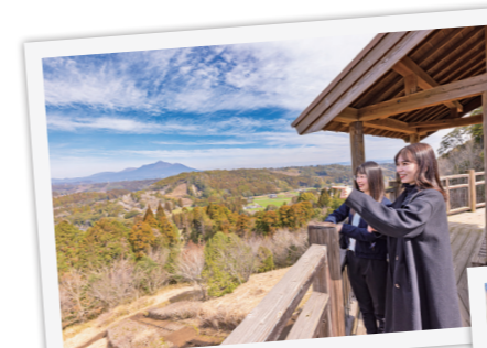
くまそ広場展望所(ビュー手フル展望台)