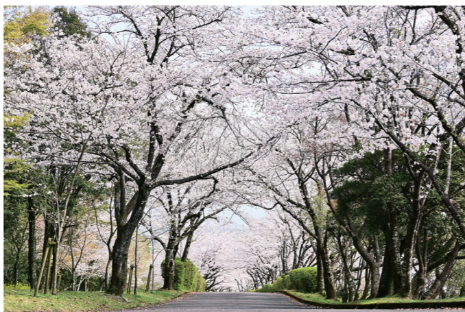
「一堂ヶ丘公園」(山田町山田)