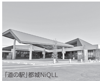
物産振興拠点施設整備事業 24億6,973万円