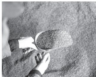
飼料価格高騰対策事業 7億1,859万円