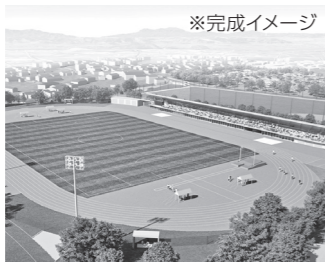
山之口運動公園整備事業 13億9,659万円