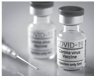
新型コロナワクチン接種費 9億5,563万円