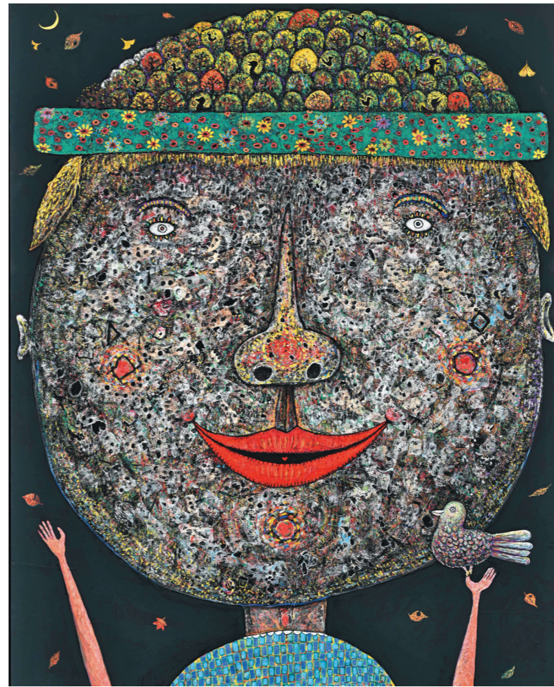
第68回市美展大賞作品 「森へおかえり」河野宗平