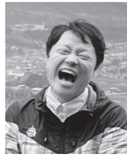
世界の中心?で愛を叫ぶ