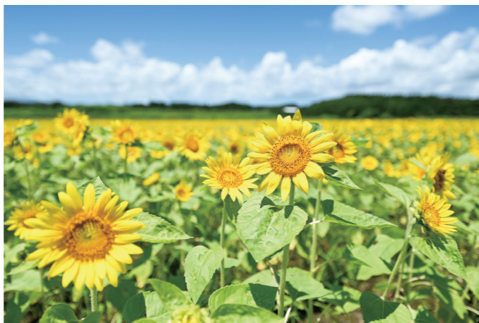
「南部ふれあい広場・ひまわり畑」(大岩田町)