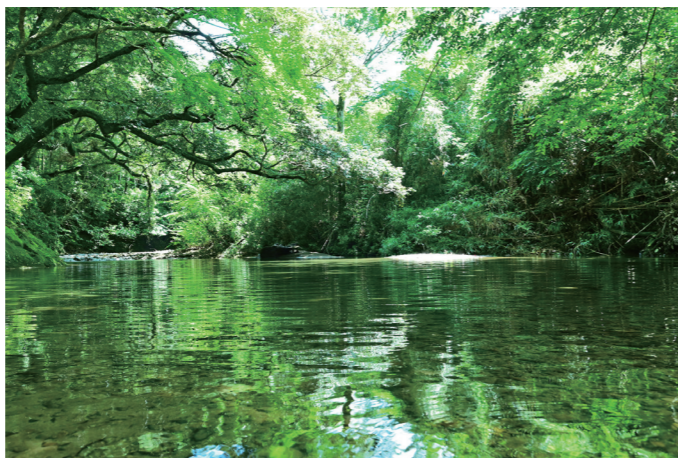
「薩摩古道」(山之口町山之口)