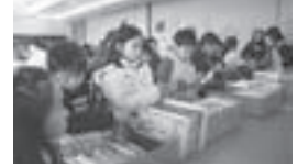
昨年の図書ふれあい広場の様子