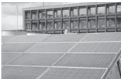
市役所南別館の屋上に設置した太陽光発電

なお、平成20年8月末現在は1,991軒でしたので、この1年2カ月間で205軒の増加となっています。