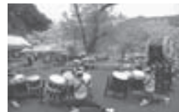
昨年の春の感謝祭の様子