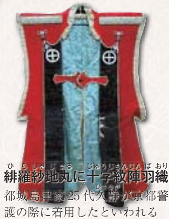
ひらしゃじまる じゅうしんじんばおり 緋羅紗地丸に十字紋陣羽織 都城島津家25代久静が京都警護の際に着用したといわれる