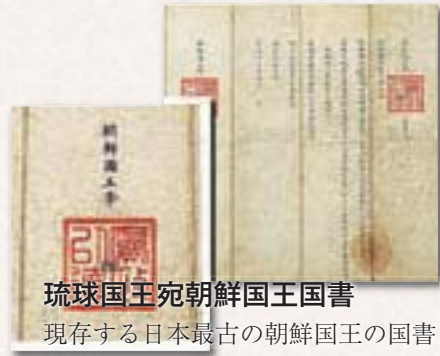
琉球国王宛朝鮮国王国書 現存する日本最古の朝鮮国王の国書