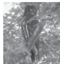
◎学校のシンボル 「アオバズク」