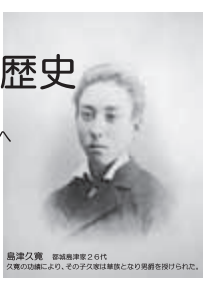
島津久實 都城島津家2代 久實の幼名により、その子女等は華姓となり美稱を授けられた。