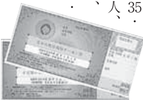
子宮頸がん・乳がん検診無料クーポン

子宮頸がん検診・乳がん検診は、女性特有のがん検診で特定の年齢の人に無料クーポンを送付しています。子宮頸がん検診は、昨年度20・25・30・35・40歳になった人、乳がん検診は、昨年度40・45・50・55・60歳になった人が対象です。早めの受診をお勧めします。