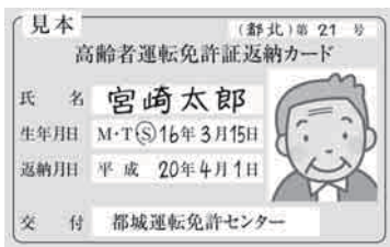
免許を返納するともらえる「高齢者運転免許証返納カード」

などの優遇制度を受けられます。また、県内の他の地域でも高齢者運転免許証返納カードを提示することで受けられる優遇措置が多数あります。優遇制度は、県警のホームページで確認することができます。 詳しくは、都城警察署交通課（☎24-0110）まで問い合わせください。