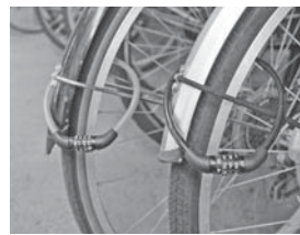
自転車の鍵を配布するイベントなどを行っています

県内の状況と似ていますが、特に自転車の盗難や空き巣ねらいなどの犯罪が多発しています。自転車には鍵をかけ、住宅はきちんと戸締りをするなどそれぞれの家庭で防犯対策を行い、犯罪を未然に防ぎましょう。