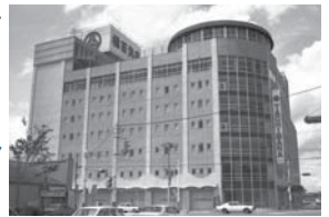
都城駅前 橋百貨店

懐かしい都城を体感。昔の新聞記事をスライドショーで見て、解説員の話聞いて、当時の流行歌を口ずさめちやうタイムスリップバラエティ「なつかしいみやこんじょサロン」…これ、新企画です。初回は昭和48～50年代の3年間を振り返ります。