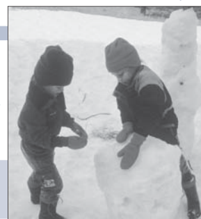
妹と雪だるまを作る6歳の私(右)