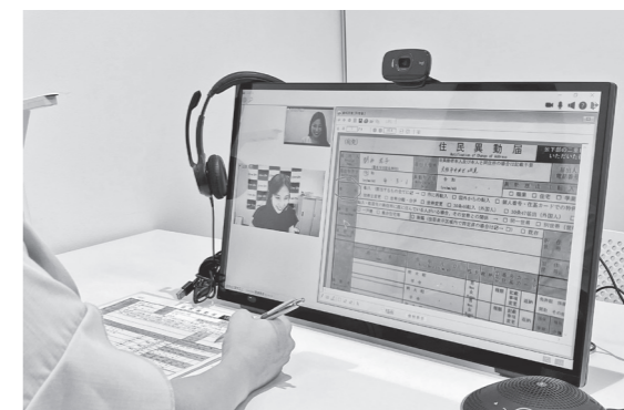
手元を映す「書画カメラ」で書類を読み取って、本庁舎の職員とオンライン上で共有できる

最寄りの総合支所または地区市民センターなどの窓口で、希望する手続きを申し出てください。予約は不要です。