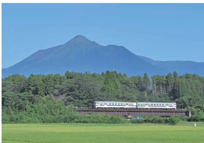
「霧島山と吉都線」(丸谷町)

「肉と焼酎のふるさと都城」を広くPRするため、毎年10月に開催する「都城焼肉カーニバル」。会場では歌や演奏などのステージを楽しみながら、都城の日本一の肉を味わうことができます。 夜には花火大会が同時開催され、音楽に合わせて夜空を彩る1万2900発(イニク)の花火も必見です。 肉と花火を一緒に楽しめる本イベントにぜひお越しください。