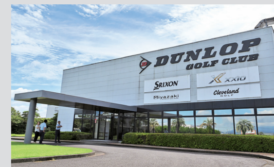
ゴルフクラブが生産されている工場。クラブの組み立て・修理に加え、クラブの部材であるカーボンシャフトの生産も行っています。