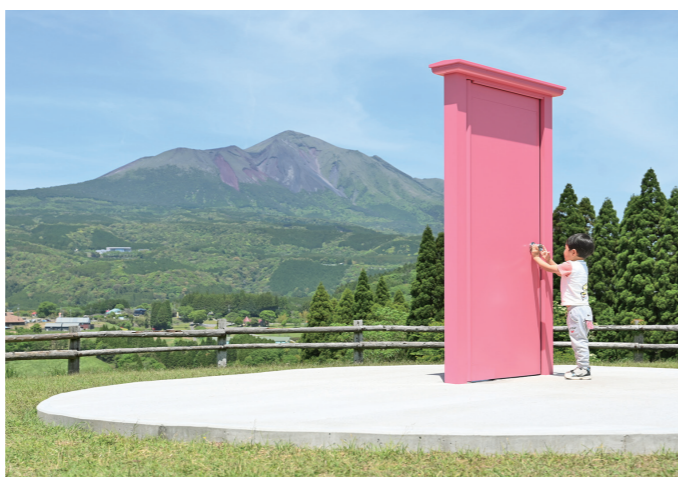
「高千穂牧場」(吉之元町)