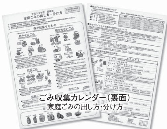
ごみ収集カレンダー(裏面)