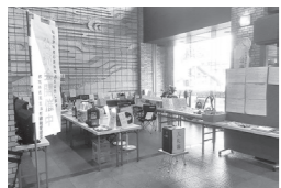
差し押さえ物品公売会

税の公平性を保つため、国税徴収法などで定められているのが「滞納処分」です。滞納の状態が続くと、滞納している人の財産（預貯金や給与、生命保険、不動産など）を差し押さえて、滞納している市税に充当します。場合によっては、滞納者宅の捜索や自動車のタイヤロックを