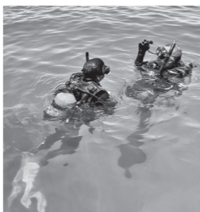
ダイビングに挑戦中！