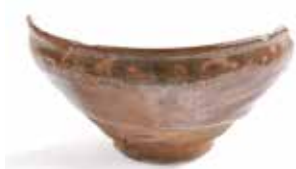
池之上城出土の天目茶碗

戦国時代、武士たちの間では「茶の湯」が流行していました。茶の湯は当時の武士たちの嗜みの一つであり、市内の城跡からも数多くの茶道具が出土しています。都城跡では、茶入れや茶臼、天目茶碗などが見つかっています。天目茶碗は黒色や褐色のうわぐずりが掛けられているのが特徴で、中国の天目山で作られたことからその名が付けられました。日本でも同じ技法のものが尾張地方（現在の愛知県周辺）の窯で大量に生産され、都城跡では中国産と国内産両方の天目茶碗が出土しています。現在開催中の企画展では、都城の出土資料と併せて、愛知県瀬戸市所蔵の完全な姿の天目茶碗や茶入れなども展示しています。