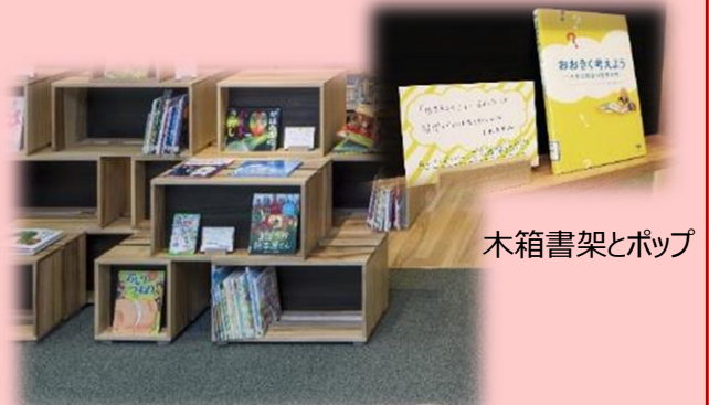
木箱書架とポップ

館内には木箱書架が約800個あり、図書館職員による手作りのメッセージカードとともに本をレコメンド。本をどんどん入れ替え、本を通じて新しい世界へ招待します。