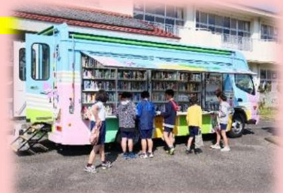
小学校巡回の様子

移動図書館車「くれよん号」が市内の小学校など26か所を巡回し、遠隔地にも図書館の本をお届けします。