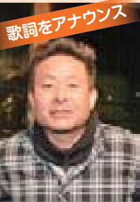
歌詞をアナウンス

シティ FM都城でラジオパーソナリティをしています。方言はふるさとの象徴だと思うので、失うことのないよう受け継いでいきたいですね。このラジオ体操も、まずは聴いて楽しんでもらい、方言の良さや大切さについて考えるきっかけにしたいです。子どもからお年寄りまで、世代を超えたコミュニケーションが活発になるよう願っています。