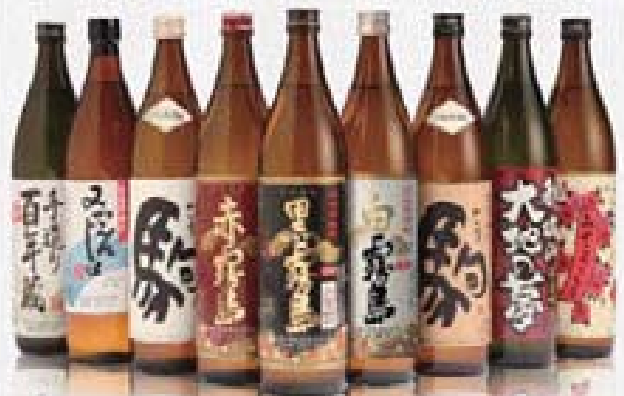
市内の酒造会社の代表的な銘柄

昨年10月に全面リニューアルし、全国の皆さんから多くのご支援を頂いている都城市ふるさと納税制度。寄付してもらった人に贈るお礼の品を、「日本一の肉と焼酎のふるさと」を象徴する牛肉と焼酎に限定して魅力度を高めたことで、「都城」を全国にPRすることができました。今年1月には、納税額が4億円(約20,000件)を突破。寄せられた寄付金は、ふるさとことも支援事業やまちづくり支援事業、災害対策支援事業などに役立てられます。