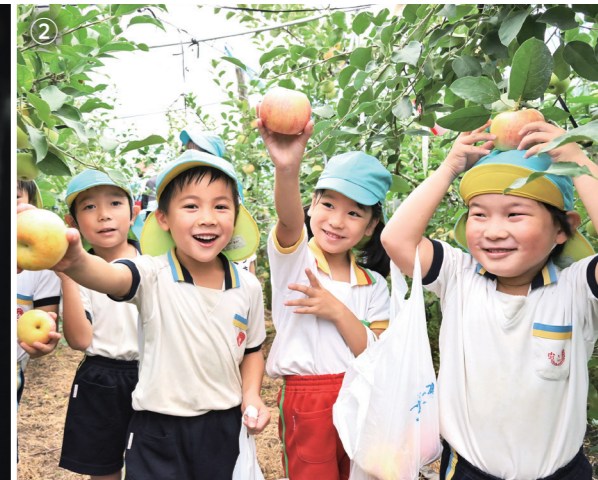
①おかげ祭り、②多田りんご園、③焼肉カーニバル、④盆地まつり、⑤こけのないからだづくり講座、⑥高崎夏まつり、⑦⑧「道の駅」都城NiQLL、⑨早水六月灯、⑩花木あげ馬