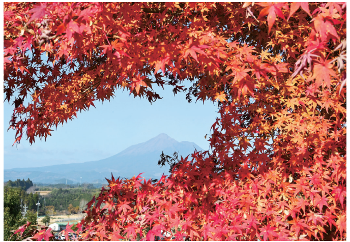
「一堂ヶ丘公園」 (山田町山田)