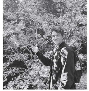
紅葉を満喫するセスさん