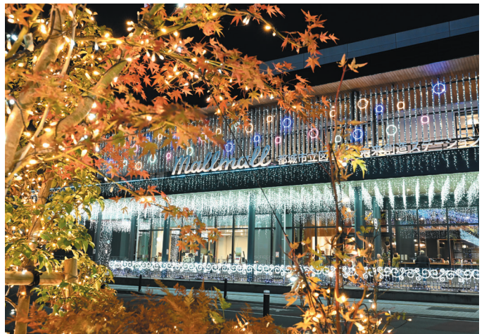
「中心市街地中核施設Mallmall」 (中町)