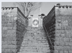
店舗の裏側にある美しい石垣