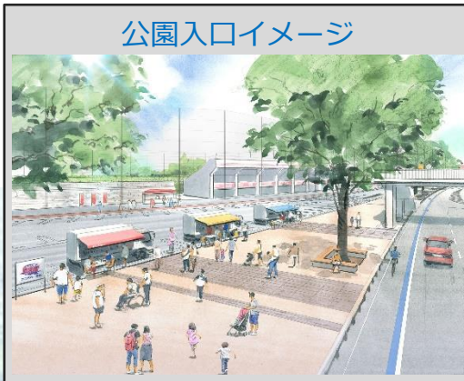
公園入口イメージ