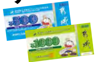
※都城商工会議所発行の商品券。 デザインは各商工会で異なります

市民の皆さんを対象に、都城商工会議所と市内の6商工会がプレミアム付き商品券を発行します。3割のプレミアムが付いた商品券を使って地元商店で買い物を楽しみましょう。