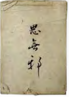
弓道や砲術など武術のあるべき姿を書き記した思無邪

そこで武士たちは、士農工商の頂点に立つ身として、また政治を行う為政者としての立場を示すため、農工商の三民の手本となることを目指し、武士らしい生き方を示そうとしました。