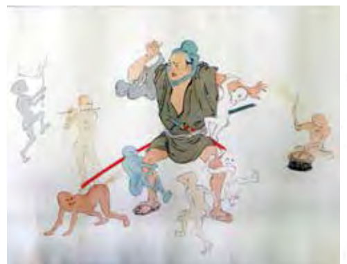
薩摩の武士、大石兵六が肝試しのために妖怪退治に出掛ける逸話をモチーフにした大石兵六夢物語絵巻

この状況に対し、都城島津家18代領主島津久理や20代領主久茂は、人事に不満を訴えた重臣たちを鳥流しにしたり、領内に対し学問や武芸に励むべきと記したお触れを頻繁に出したりするなど、さまざま政策を打ち出していきました。